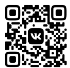
ПАБЛИК В СОЦСЕТИ «ВКОНТАКТЕ» HTTPS://VK.COM/KAFEDRA_DZOT

Созданная группа в соцсети позволит учителям физкультуры оперативно обмениваться лучшими практиками, делиться опытом регионов, конкретных образовательных учреждений.