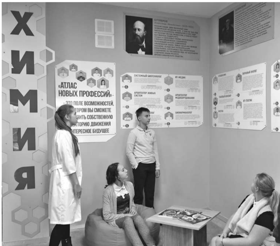
Профориентационная зона в школе № 1