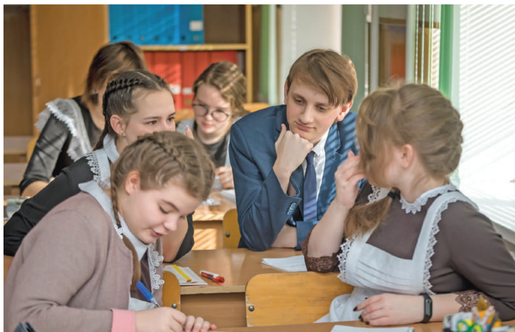
Урок обществознания в 10-м «Б» классе

Ольга МУШТАЕВА » ТЕКСТ