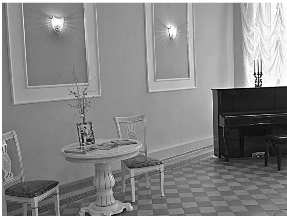
Ольгинский зал школы № 1