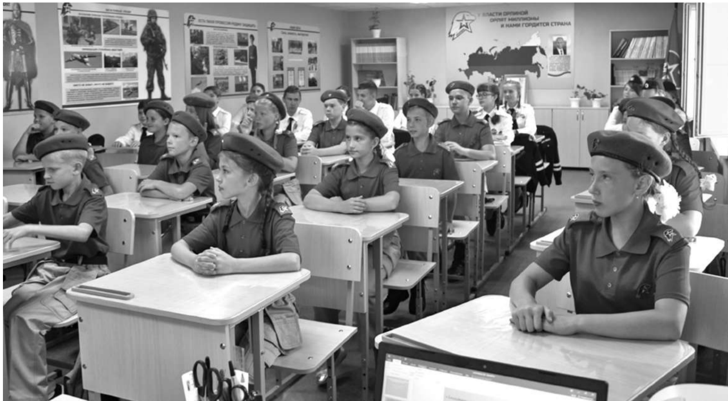
Кадетский класс школы № 1

В результате реализации проекта в школе создали лабораторию, которую можно без преувеличения назвать кузницей пытливых, талантливых юных исследователей. Ученики от четвёртого до выпускного классов занимаются наукой. В рамках постпроектной деятельности рядом с лабораторией оформлена развивающая зона «Химия занимательная и увлекательная», которая рассказывает об опытах,