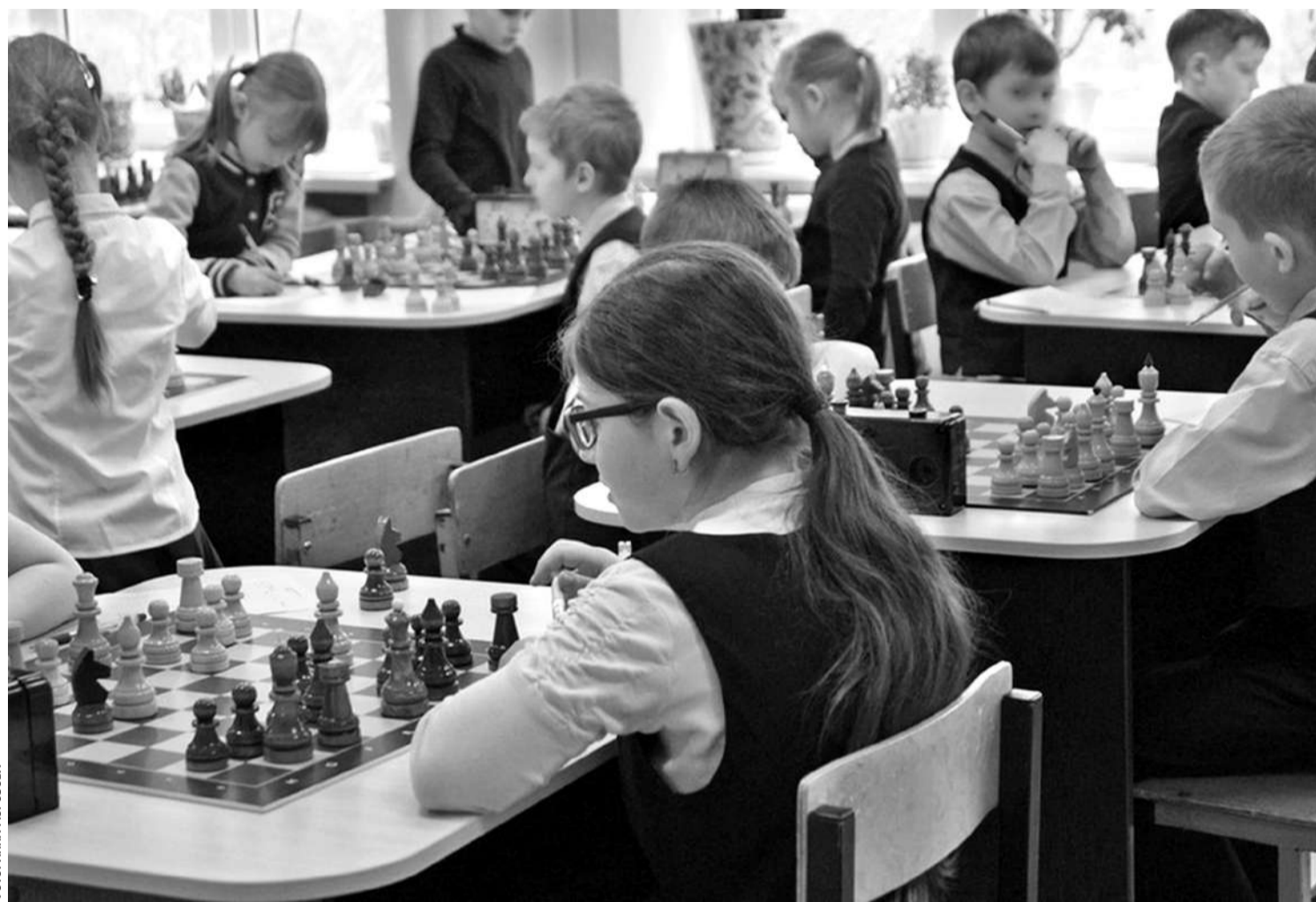
В образовательном комплексе «Луч»

— Высокий уровень локального нормотворчества. В этих учебных заведениях есть хорошо проработанные локальные нормативные акты, которые обрабатывают порядок. Основные образовательные программы и программы развития направлены на активное познание мира, развитие учебно-исследова-