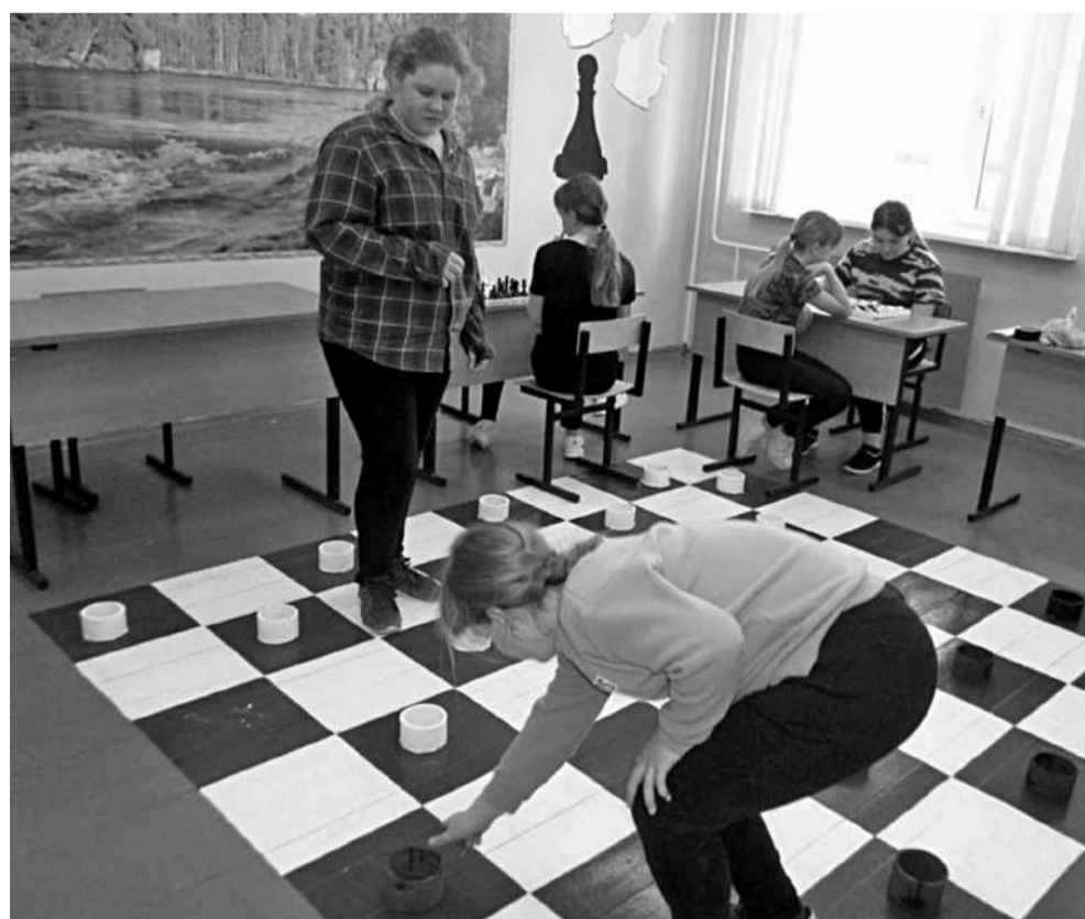
Игровая зона в Глинской школе