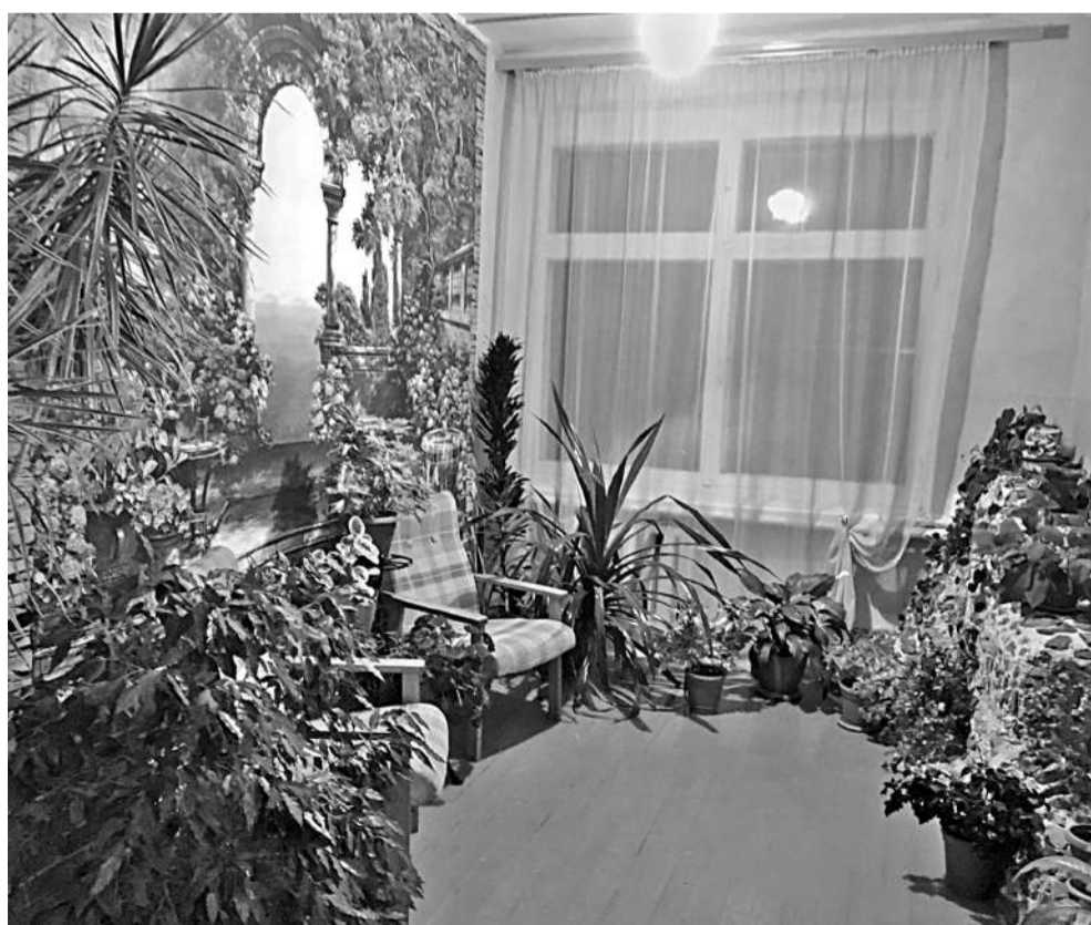
Зимний сад в Васильдольской школе