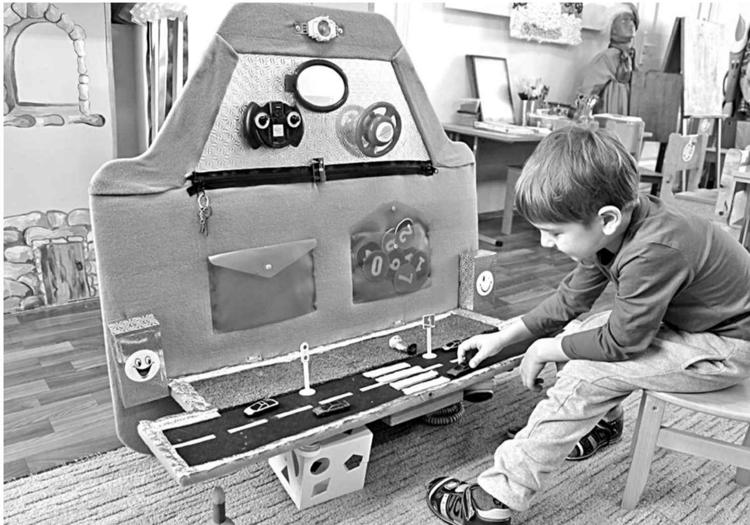
Игровая зона в детском саду № 8

СЕГОДНЯ СВОИМ ОПЫТОМ ДЕЛЯТСЯ УЧРЕЖДЕНИЯ ОБРАЗОВАНИЯ НОВООСКОЛЬСКОГО ГОРОДСКОГО ОКРУГА