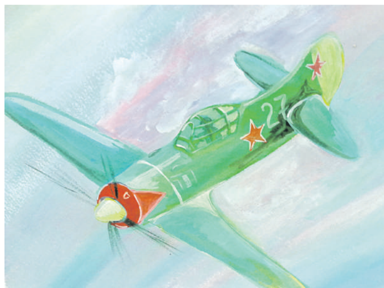
Воздушный бой. Рисунок Дмитрия Новикова (Корочанская школа им. Д. Кромского)