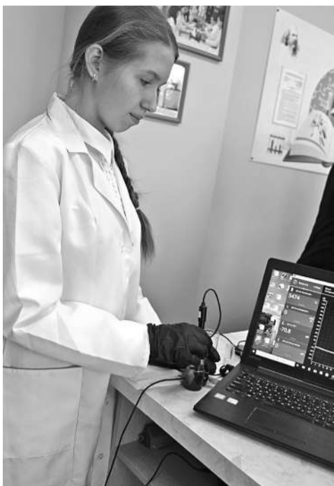
В школе № 1

КОЛЛЕГИ! МЫ ПРИГЛАШАЕМ ВАС СТАТЬ НЕ ТОЛЬКО ЧИТАТЕЛЯМИ, НО И АВТОРАМИ ГАЗЕТЫ!