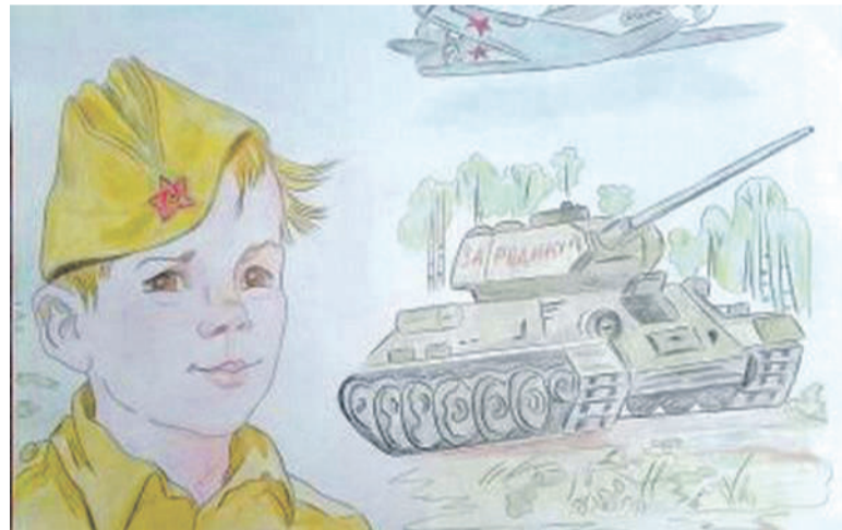
Рисунок Дарьи Лопиной (Корочанская школа им. Д. Кромского)